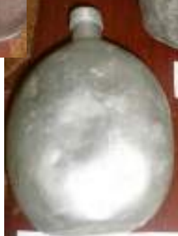
Фляжка Объект экспозиции музеев «Битва за Днепр» Часть 111 к 1000 шт